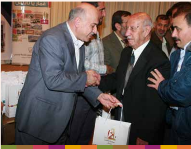
حفل تكريم الموظفين المتقاعدين ٢٠٠٩/١١/١٣