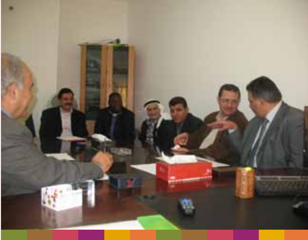
إجتماع مجلس الخدمات المشترك ٢٠٠٩/١٠/١١