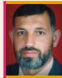
الشيخ حسام الدين القتلوني مقرر لجنة الصحة