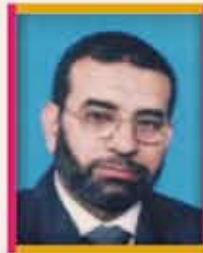
الشيخ فياض الأغبر مقرر لجنة الشباب والرياضة