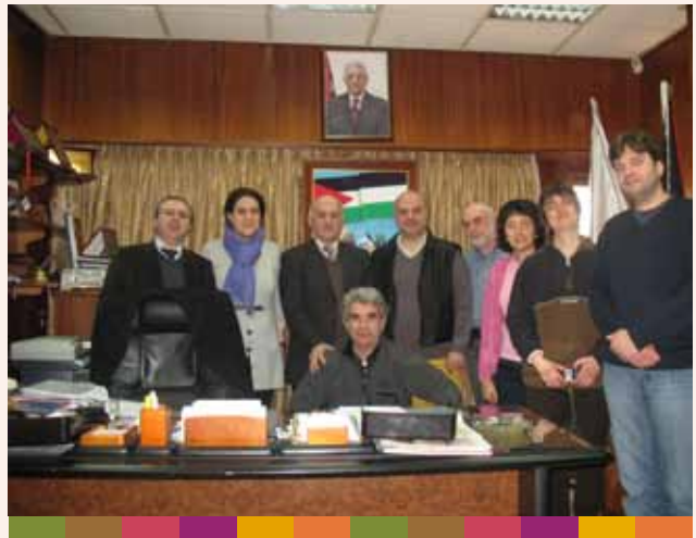
وفد من مقاطعة اومبريا الإيطالية ٢٠٠٩/٧/٢٢