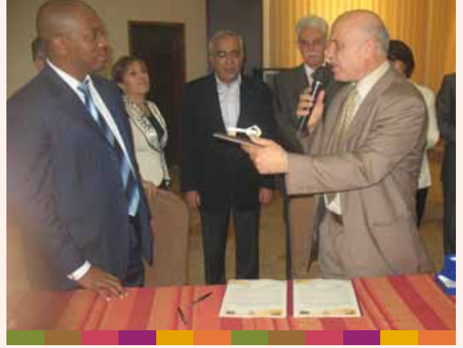
توقيع إتفاقية تناهم مع ممثلية جنوب إفريقيا ٢٠٠٩/٧/١٩