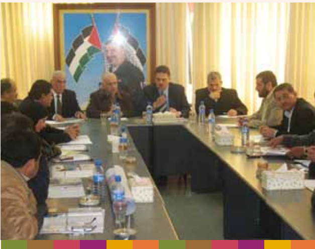
زيارة وكيل وزارة الأشغال ٢٠٠٩/٣/٢٢