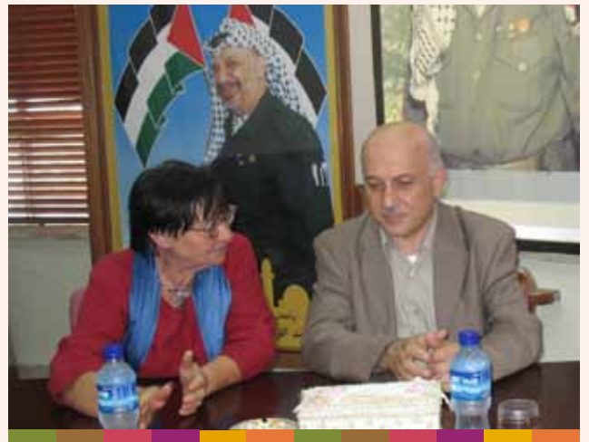
زيارة لويزا مورغنثيني عضو البرلمان الأوروبي ٢٠٠٩/٧/٢٢