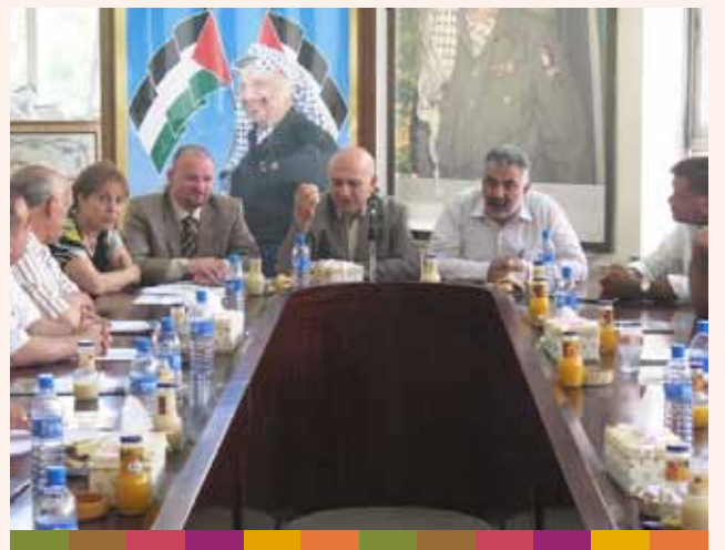
وفد بلدية جنين والإطلاع على مركز خدمات الجمهور ٢٠٠٩/٦/٦