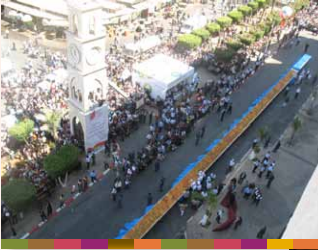
فعالية أكبر سدر كنافة