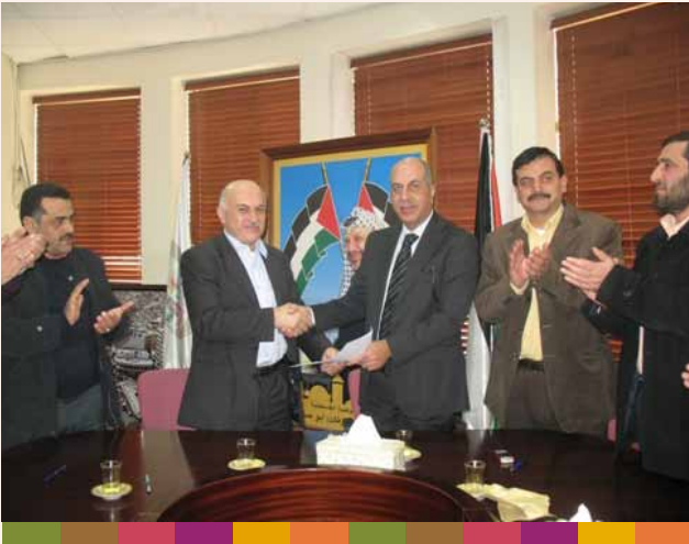
توقيع عطاء مشروع خفض الفاقد