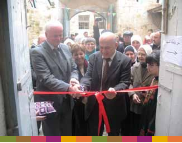
إفتتاح معرض زهر الربيع للمنتجات النسوية ٢٠٠٩/٣/٢٩