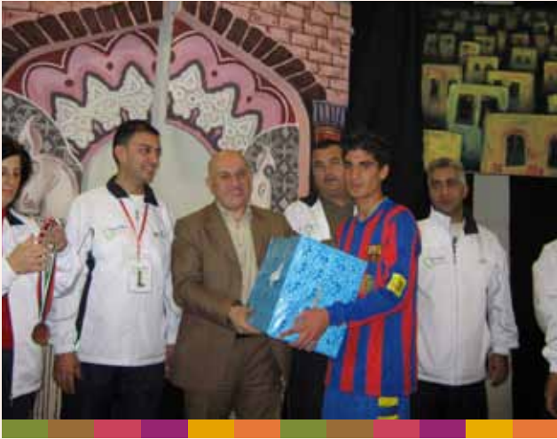
حفل توزيع الجوائز للفائزين في سباق الماراثون ٢٠٠٩/١٠/٣٠