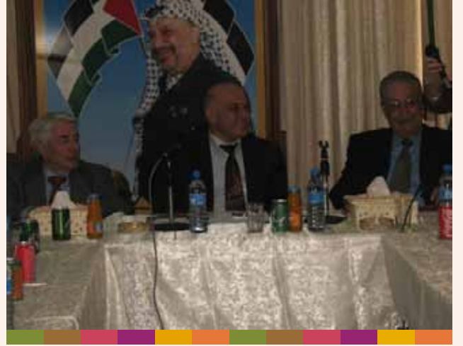
زيارة وزير التعاون الدولي لإقليم توسكان - إيطاليا ٢٠٠٩/٦/٤