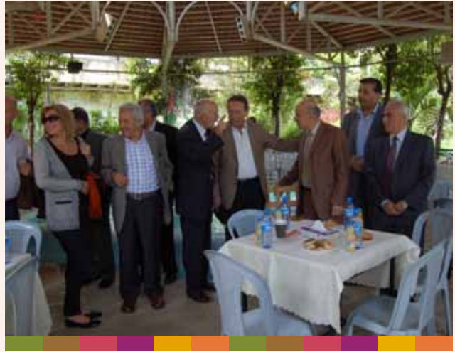
زيارة وفد مؤسسة التعاون ٢٠٠٩/٠٤/٢٧