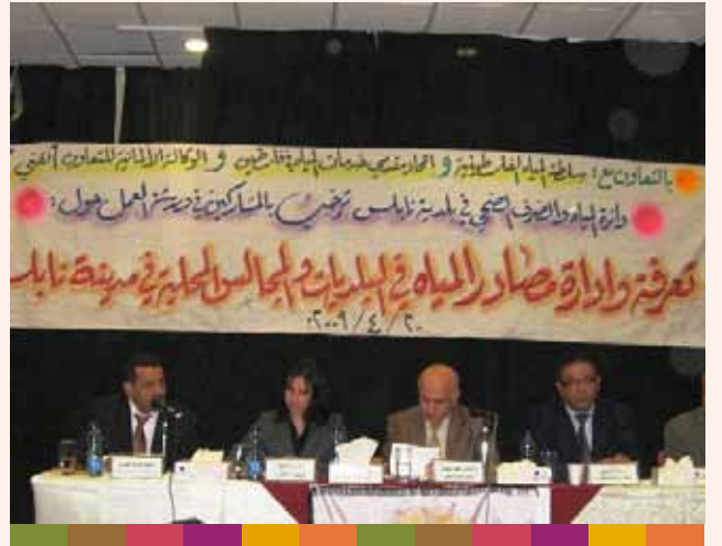
ورشة عمل مع البنك الدولي حول تعرفه المياه ٢٠٠٩/١١/١٩