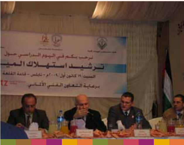
ورشة عمل حول ترشيد إستهلاك المياه بالتعاون مع الـ GTZ ٢٠٠٩/١٢/١٩