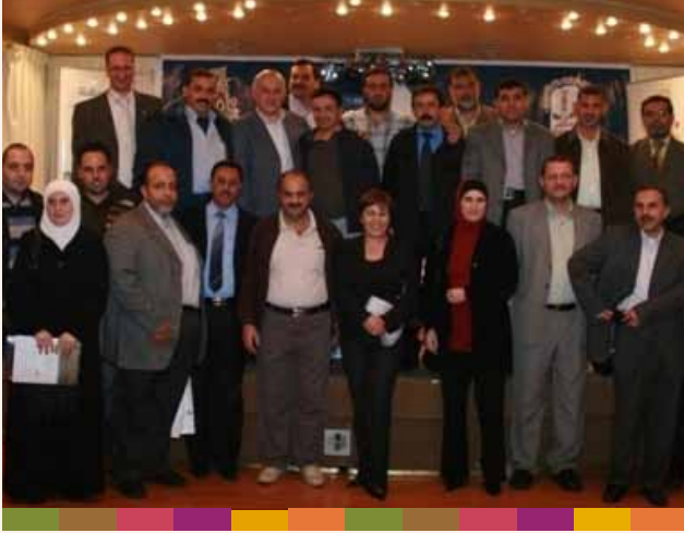
حفل تكريم المتقاعدين ٢٠٠٩/١١/٣