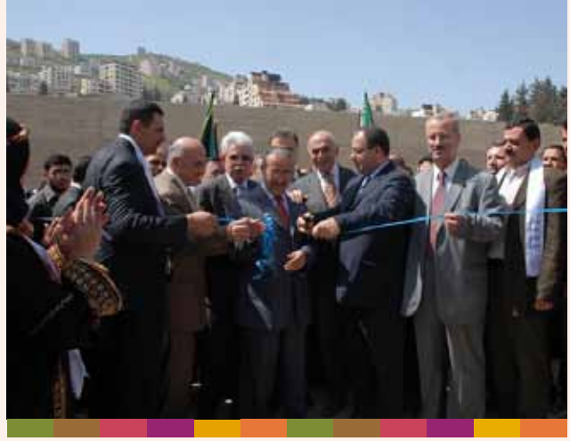
إفتتاح معرض الأصالة والإبداع ٢٠٠٩/٤/١٣