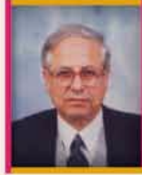
الدكتور نهاد المصري رئيس البلدية بالوكالة