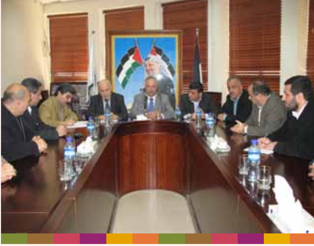
زيارة وزير الحكم المحلي لبلدية نابلس ٢٠٠٩/١٢/٢٢