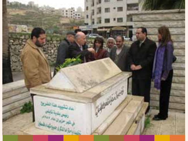
زيارة وزير الثقافة الأردني والوفد المرافق ٢٠٠٩/١١/١٩