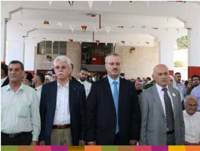
إنطلاق فعاليات مرور ١٤٠ عام على تأسيس البلدية