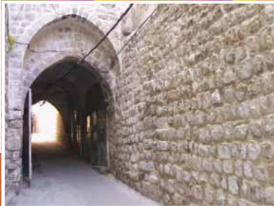
• بعد الترميم