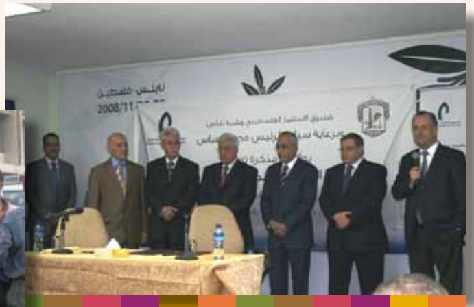
توقيع إتفاقية المنطقة الحرفية / مؤتمر الإستثمار